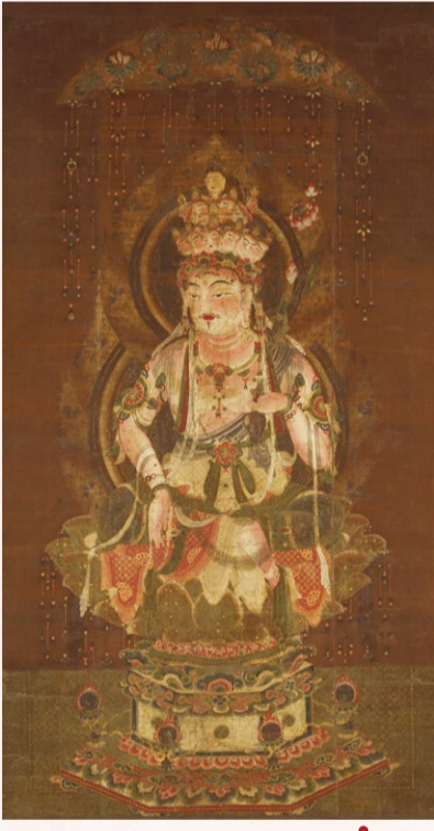
鮮やかな色彩と 精緻な文様の美麗なる仏画