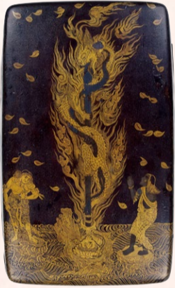
黒漆に浮びあがる 金色の龍