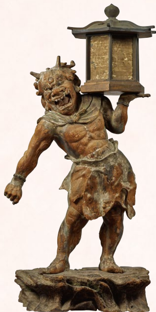
国宝 天燈鬼立像 鎌倉時代・建保3年(1215) 奈良・興福寺 展示期間:4月19日～5月18日