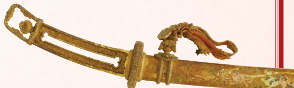
国宝 金地螺鈿毛抜形太刀(部分) 平安時代・12世紀 奈良・春日大社 展示期間:4月19日～5月18日