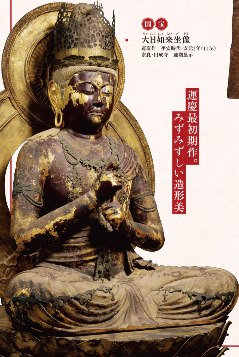
国宝 大日如来坐像 運慶作 平安時代・安元2年(1176) 奈良・円成寺 通期展示