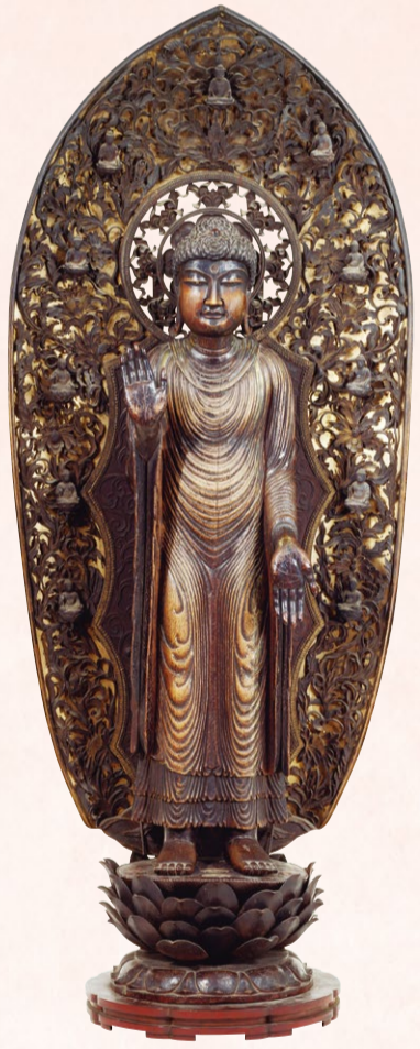
真の釈迦の姿を写したという 伝説の霊像