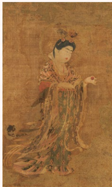
国宝 吉祥天像 奈良時代・8世紀 奈良・薬師寺 展示期間:4月19日～5月6日