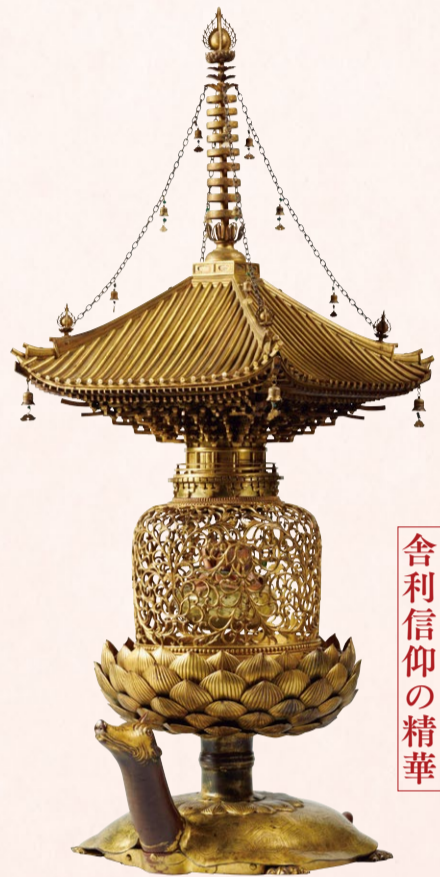
黄金の亀が護る 舍利信仰の精華