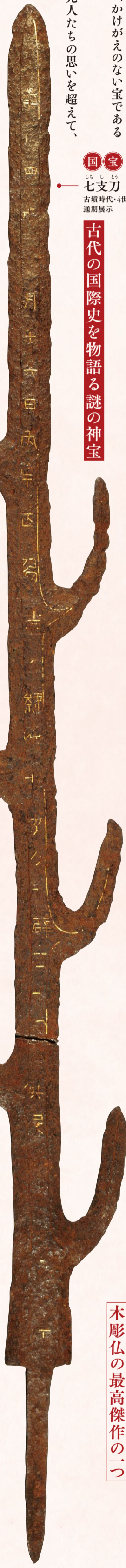
国宝 七支刀 古墳時代・4世紀 奈良・石上神宮 通期展示