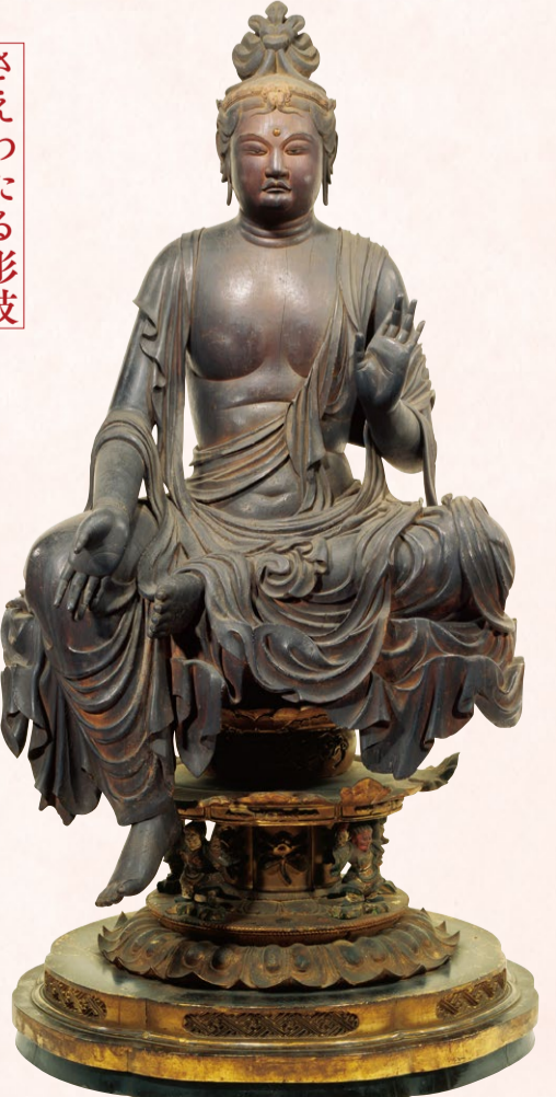
国宝 菩薩半跏像 (伝如意輪観音) 奈良~平安時代・8~9世紀 京都・宝菩提院願徳寺 通期展示