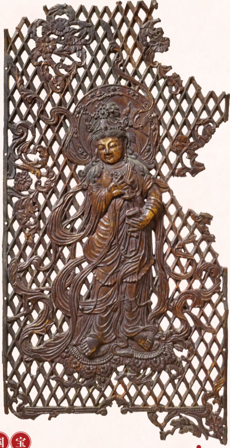
音楽を奏でる菩薩の姿に 天平の音色が湧きあがる

一三〇年にわたる歴史を超え、国宝を生み出した先人たちの思いを超えて、文化の灯を次の時代につなぐため、奈良博が踏み出す 新たな一歩をご覧ください。