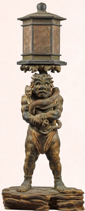
国宝 龍燈鬼立像 鎌倉時代・建保3年(1215) 奈良・興福寺 展示期間:4月19日～5月18日

演秘密之法甚深空性皆已了知無後起也 其石日無障礙特法輪菩薩常欲心對法 若菩薩精進菩薩不休身菩薩慈氏菩薩 吉祥菩薩願自在菩薩持日在王菩薩 辯莊嚴王菩薩妙高山王菩薩大海深王 薩寶薩寶菩薩大寶薩寶地薩寶薩寶 薩寶寶手自在菩薩金剛手菩薩歡喜力 薩大法力菩薩大莊嚴光菩薩大金光 菩薩淨戒菩薩常定菩薩極清淨菩薩 回精進菩薩心如虛空菩薩不斬大願菩薩 施藥菩薩淨諸煩惱菩薩摩訶王菩薩歡 高王菩薩得上授記菩薩大雲淨光菩薩 雲持法菩薩大雲名稱菩薩樂菩薩大雲 邊持菩薩大雲師子菩薩大雲牛王菩薩 大雲吉祥菩薩大雲寶薩菩薩大雲日 薩大雲月藏菩薩大雲星光菩薩大雲 光菩薩大雲電光菩薩大雲雷音菩薩大 梵雨光通菩薩大雲清淨雨王菩薩大雲 樹王菩薩大雲有蓮華香菩薩大雲寶祿 香清涼身菩薩大雲除闇菩薩大雲破障